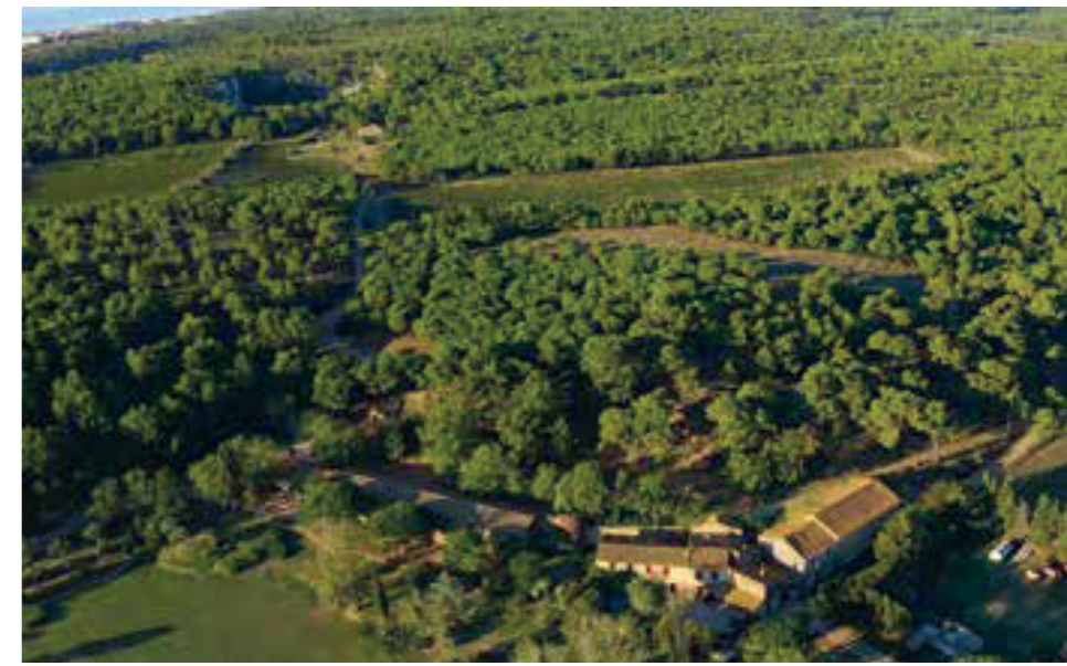
- Vue du "Domaine de l'Oustalet" -

Ce circuit familial vous fera aimer la pratique du VTT. Vous quitterez le domaine de l'Oustalet en passant par la droite. Vous suivrez les pistes roulantes vers les hauteurs du massif de la Clape. Au poteau "Four de Rome", vous prendrez la direction du "Domaine de l'Oustalet", qui vous ramènera à votre point de départ en passant aux pieds de la villa gallo-romaine, dans un décor de garrigue méditerranéenne. A pratiquer en famille ou pour le plaisir de rouler.