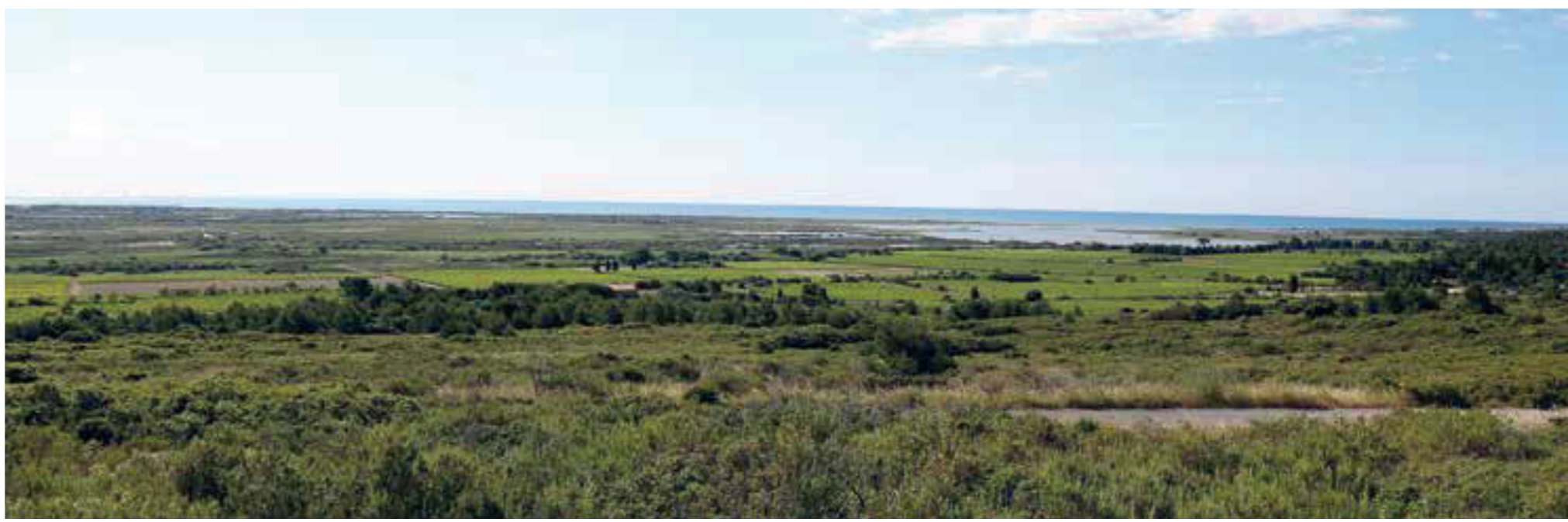
- Vue de "La Clape" -